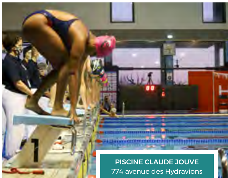
PISCINE CLAUDE JOUVE 774 avenue des Hydravions 04 42 85 36 06