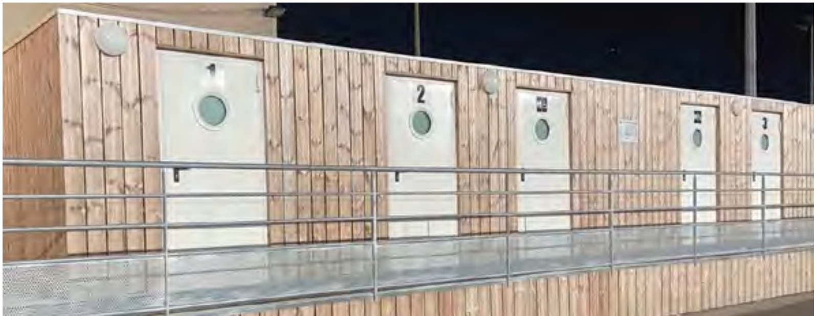
Vestiaires du stade Roger MARTIN

Être volontaire : 04 42 74 94 22 ou le.maire@berreletang.fr