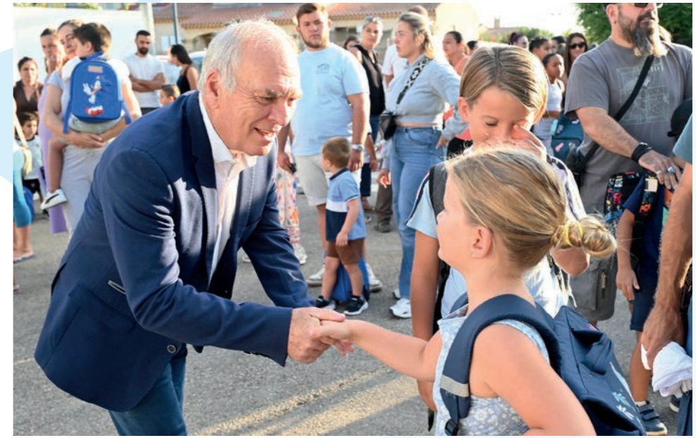
Le maire avec les jeunes Berrois